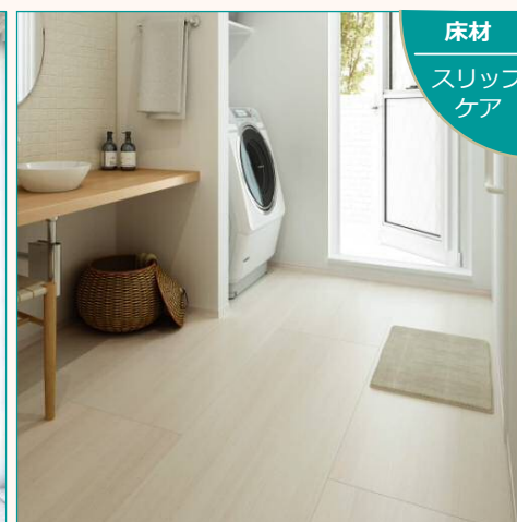
床材 スリップ ケア DAIKENのスリップケアで 補助工事単価 ¥9,900/m 2 の 1/3 を補助 (劣化対策) ※木造のみ対象(下地は耐水合板とする)