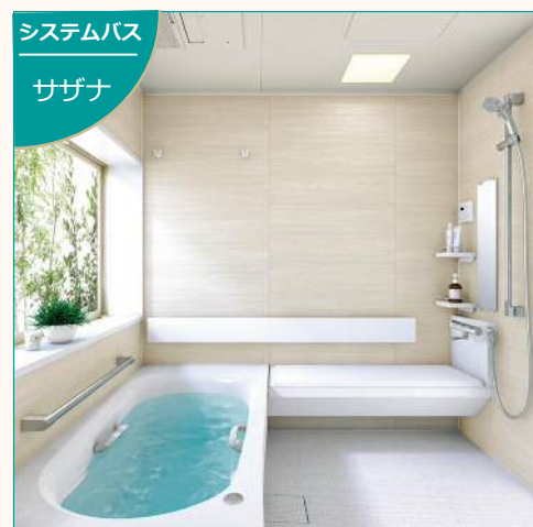
システムバス サザナ TOTOのシステムバスで 補助工事単価 ¥240,000 の 1/3 を補助 (劣化対策) ※既存が木造か在来浴室から取替えの 場合のみ対象