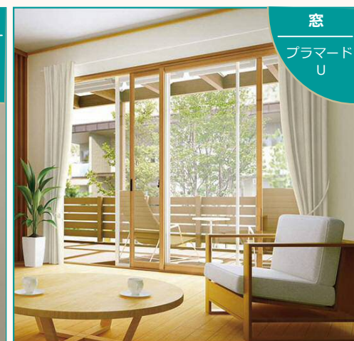
窓 プラマード U YKK APの内窓 プラマードUで 補助工事単価 ¥79,800/箇所 の 1/3 を補助 (大サイズの場合)(省エネルギー対策)